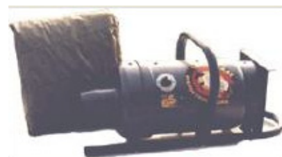
Couverture avec soufflante