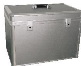
Caisse de rangement